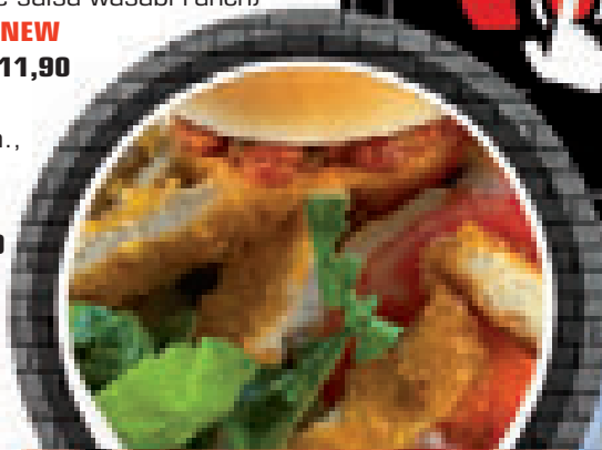
REAL CHICKEN SLICES