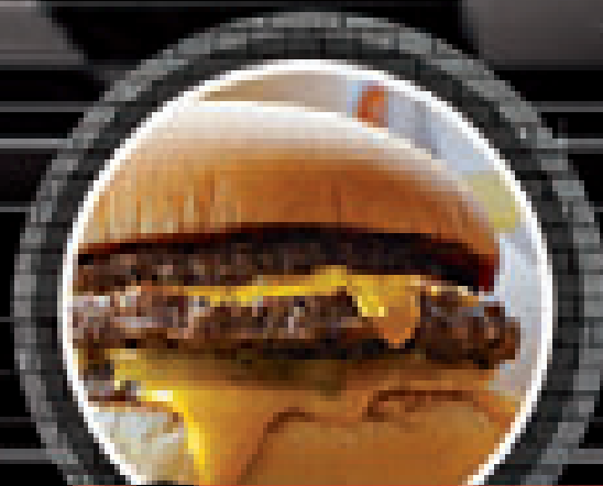
D.D. BACON CHEESE

(300 gr., doppio burger, bacon, cheese e salse)